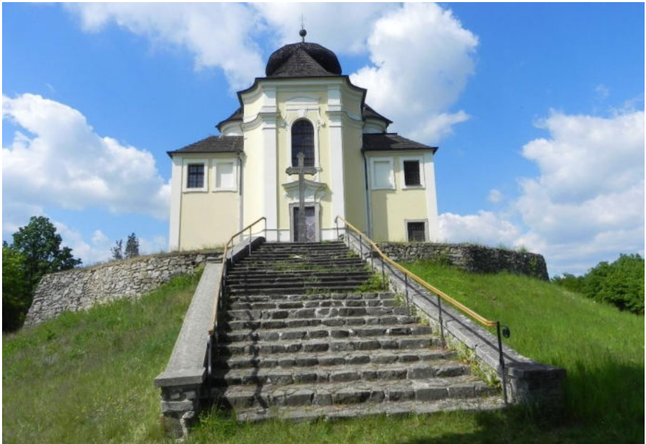
Kostel sv. Jana Křtitele a Panny Marie Karmelské na Makové hoře

Dolní Polabí v zahradě Čech a v litoměřické vinařské oblasti. Co víc si přát? Už jen navštívit nějaké krásné poutní místo. Aby romantika byla ještě umocněna, tak se tam dostanete lodním přívozem přes Labe v obci Nučnický-Nučnice. V Křešicích se nachází kostelík Navštívení Panny Marie s přilehlou studánkou. Bohužel voda není pitná, za což může intenzivní chemizace okolních polí. Na obvodové zdi kostelíka je ve výšce čtyř metrů značka, kam až se až rozlilo Labe při povodni v roce 2002.