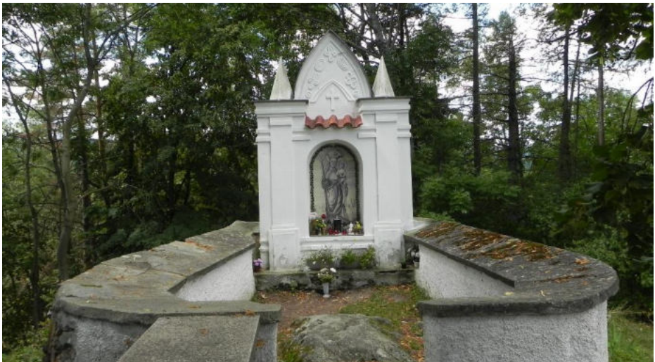
Kaplička se studánkou za kostelem ve Strašíně

V krajině mezi Rakovníkem a Louny se nachází krajina zvaná Džbán. Do Solopysk je dobré spojení vlakem a odtud pěšky asi hodinu přes Ročov do Dolního Ročova. Po cestě v Ročově je studánka. Kousek se jde také skrz