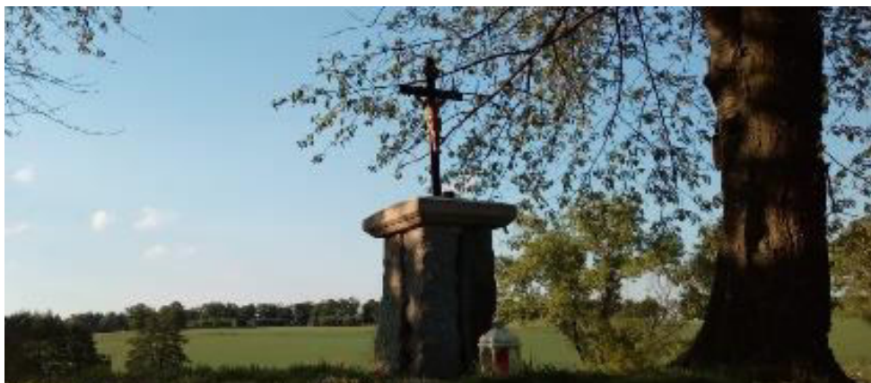
Kříž na někdejší rozcestí před Voděrádkami.