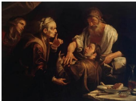
Izák žehná Jakobovi, Gioachino Assereto, r. 1640.