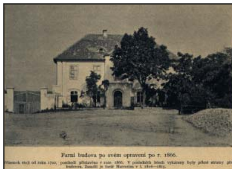
Paněl budova po svém opravěni po r. 1866. Hrnka v r. 1812, pohlední přehled v r. 1866. V původním domě vykazany byly ještě stromy po budově. Značí je šedý horizont v l. 1812–1816.